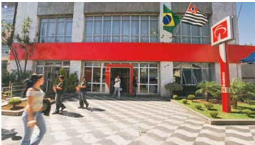
Agência Lapa, São Paulo (SP)

As empresas da Organização Bradesco que atuam no mercado de seguros, vida e previdência e consórcios também são líderes em seus segmentos.