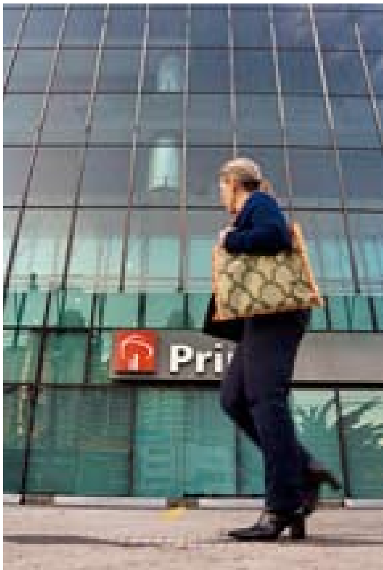
Agência Prime, Edifício Dacon, São Paulo (SP)

Este processo, que reúne clientes de um mesmo perfil, permite atendimento diferenciado e crescentes ganhos de produtividade e rapidez. Focado no relacionamento, proporciona ao Banco maior flexibilidade e competitividade na execução de sua estratégia de negócios, dando dimensão às operações, quer para pessoas físicas ou jurídicas, em termos de qualidade e especialização.