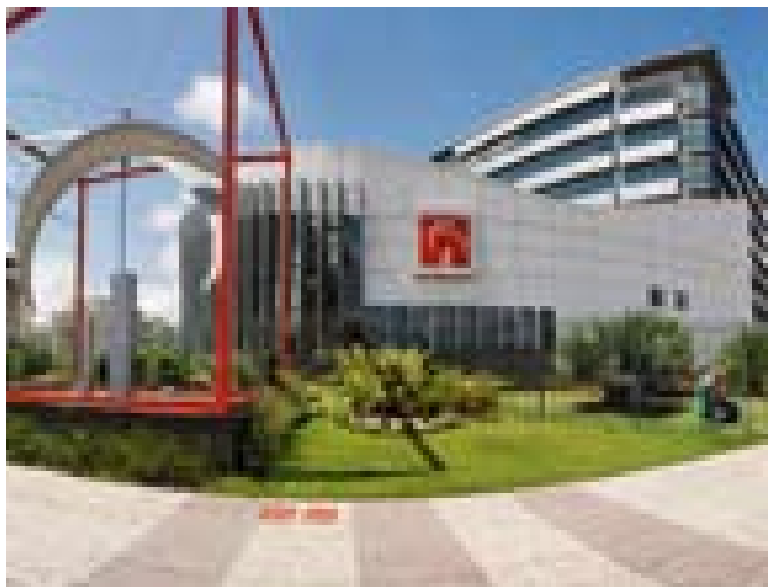
Agência Barra da Tijuca, Rio de Janeiro (RJ)

Presente em todo o Território Nacional e em diversas localidades no Exterior, a Rede de Atendimento da Organização Bradesco está dimensionada para oferecer padrões adequados de eficiência e qualidade. Em 31 de dezembro, estava composta por 26.459 pontos de atendimento, conforme segue: